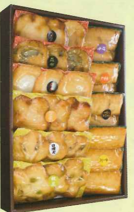
品番 四季-5 5,000円