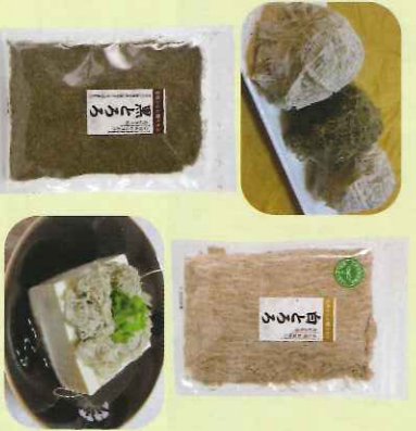
品番 H-1 (2枚×17袋) 550円 品番 H-2 (2枚×17袋) 900円

しろえび紀行 ほんのり香る、しろえびの風味 と旨味を、塩味でさらに美味し く仕上げたおせんべいです。