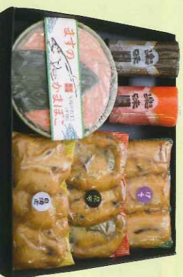
品番 四季-3 3,300円