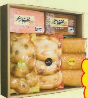
品番 四季-2 3,160円

四季揚いかげそ、たまねぎ、チーズ、枝豆 各1パック 四季揚チーズ、たまねぎ、枝豆 各1パック 四季揚いちげそ、たまねぎ、チーズ、枝豆 各1パック