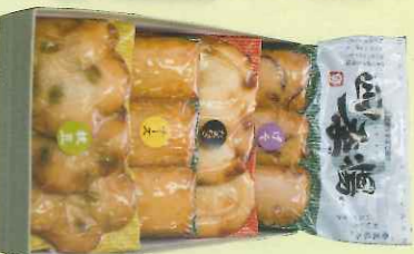
品番 四季-1 2,150円

四季揚げかまぼこは、とことん素材にこだわった自慢の味!! 海の幸、山の幸が盛り沢山!! 味は全部で15種類、そのまの素材でシンプルに食べるのもよし! 炒めてもよし! 煮てもよし! お好みでマヨネーズやソースをつけても相性バツグン!! いろいろいるいるな調理方法で楽しんでいただける商品です。寒い冬にはおでんなどにも最適ですよ!