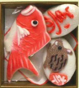
品番 ETO-S 3,510円