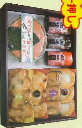
品番 四季-4 4,100円